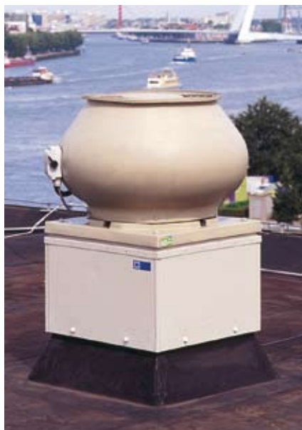
CAS met montagekast en dakopstand