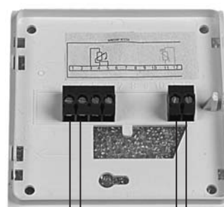
Potmeter 1.000 Ohm