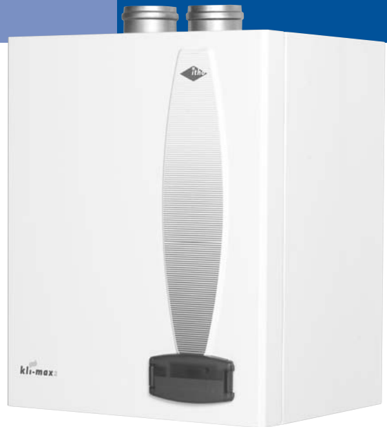
Itho HR-combiketel Kli-Max 2.

De verbranding in de ketels vindt plaats door een Econox gas/lucht voorgemengde stralingsbrander, die onder alle omstandigheden een optimale schone verbranding waarborgt.