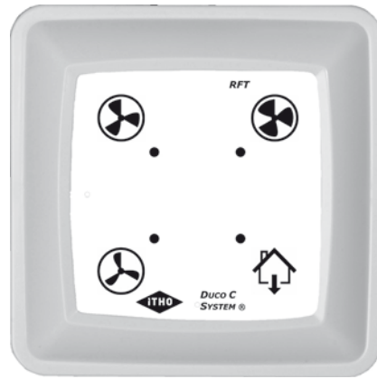
RFT bedieningsschakelaar Duco C System®.

Om een RFT bedieningsschakelaar aan te melden moet eerst de voedingsspanning van de unit worden onderbroken door de stekker uit het stopcontact te halen en deze daarna weer in het stopcontact te doen. Vervolgens moet binnen 5 minuten de RFT bedieningsschakelaar worden aangemeld bij de ventilatie-unit. Dit kan worden gedaan door twee diagonaal geplaatste knoppen van de RFT bedieningsschakelaar langer dan één seconde tegelijkertijd in te drukken. Als de RFT bedienings-